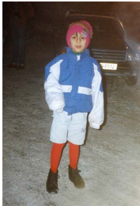
Julen 1989 på Nesodden asylmottak, med klær fra mottaket

For å gjøre en lang historie kort; min 13 år gamle søster gikk i løpet av noen dager fra å være en innsluttet og from muslimsk tenåringsjente, til å bli en utfordrende tenåring i opposisjon. Hun klarte å forelske seg i en gutt på mottaket, og den dagen da smuglere skulle smugle oss videre til Sverige, hop-